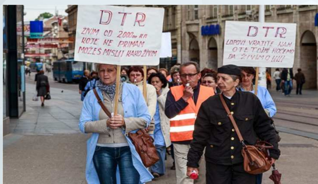
Zagreb, 2013, DTR - Domaća tvornica rublja d.d.

Štrajk tekstilnih radnica Prosvjedna povorka štrajkašica „ŽIVIM OD 2000 kuna (262 eur) KOJE NE PRIMAM. MOŽEŠ MISLITI KAKO ŽIVIM?”