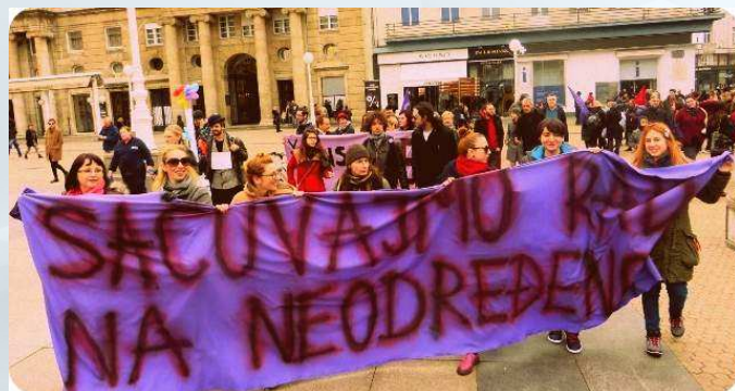
“Sačuvajmo rad na neodređeno” Zagreb, Dan žena 2014. Ženska fronta za radna i socijalna prava